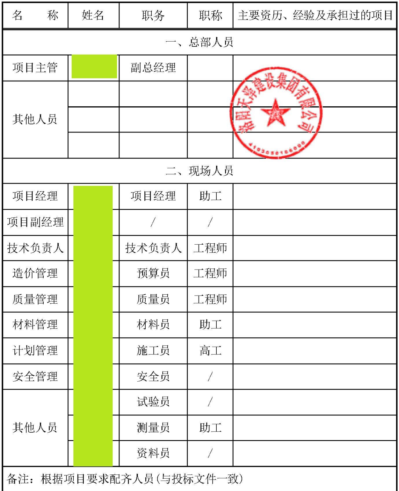
附件 6：承包人主要施工管理人员表