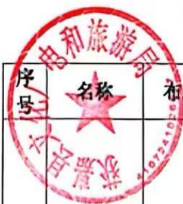
2024年服装采购项目清单（三标段）