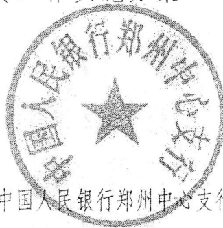
中国人民银行郑州中心支行